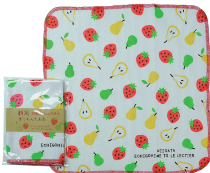
越後姫とルレクチェ